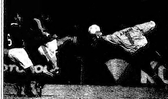
تاجي صبي لامب الانتصار اللبناني (في اليسار) يهزعه بفرحة